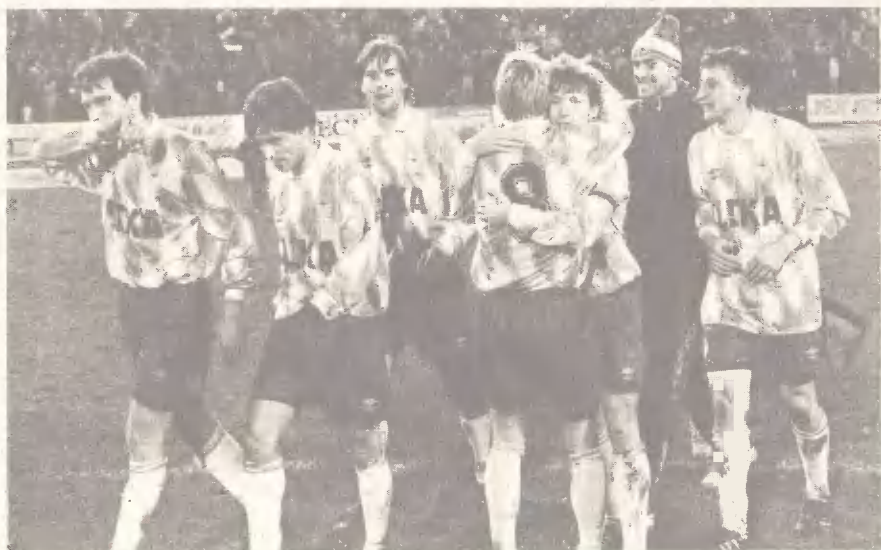
И вот настал он, миг победы... Футболисты ЦСКА — чемпионы страны.